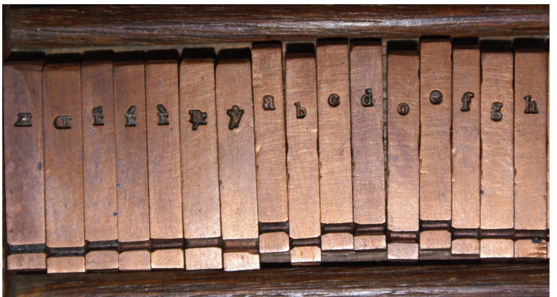
Matrijzen van Rosarts Garamonde Romaine