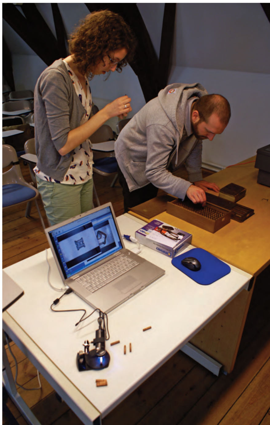
Digitale microscoop, matrijzen en stempels